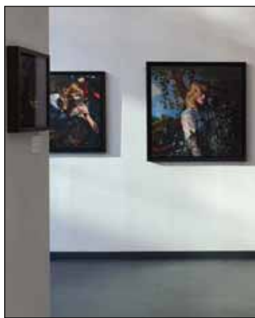
Door kunst leer je jezelf beter kennen PAGINA 5