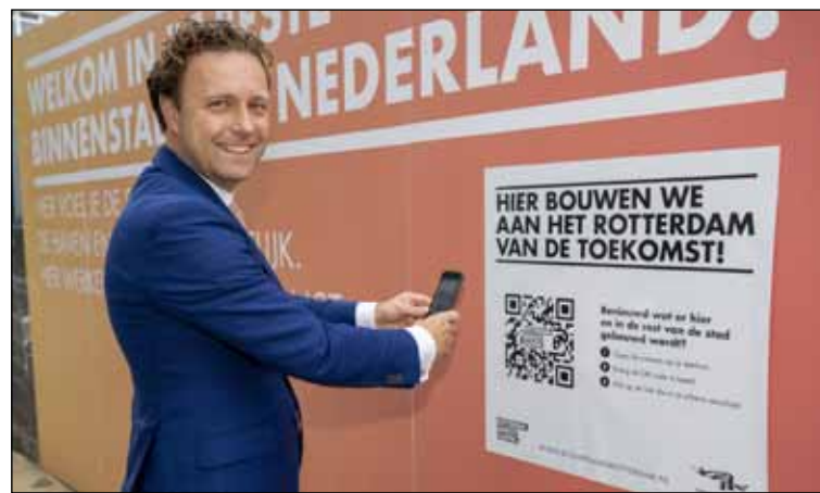
Unieke inblik in bouwproductie PAGINA 6