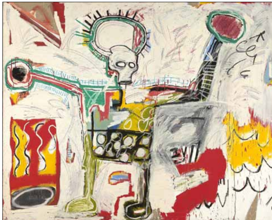
Jean-Michel Basquiat / Untitled / 1982 / Museum Boijmans Van Beuningen Rotterdam

Nu Museum Boijmans Van Beuningen dicht is voor renovatie brengt het delen van de collectie onder bij naburige musea. Hét moment om de collecties voor het eerst bij elkaar te brengen in een unieke remix. Deze tentoonstelling kwam tot stand in het kader van Boijmans bij de Buren en is mede mogelijk gemaakt door de Stichting Droom en Daad.